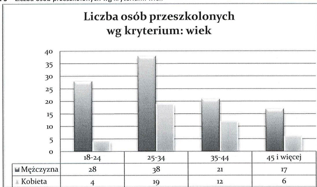
Wyk. 5 – Liczba osób przeszkolonych wg kryterium: wiek