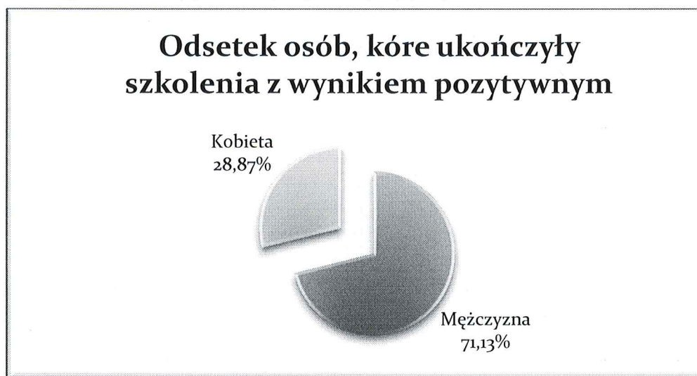
Wyk. 4 – Liczba osób, które ukończyły szkolenia z wynikiem pozytywnym