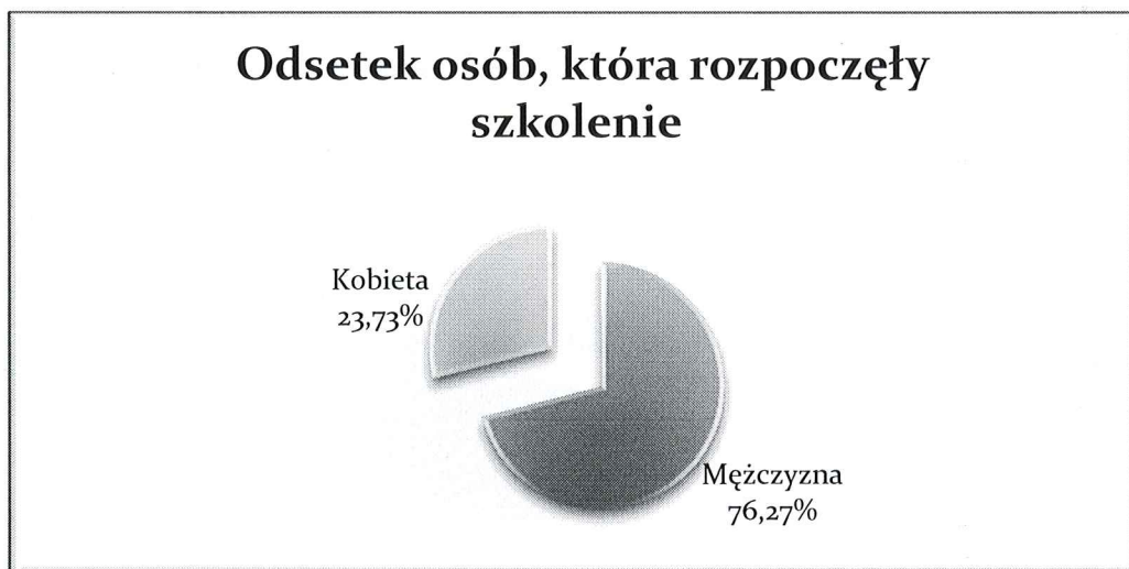
Wyk. 3 – Liczba osób, która rozpoczęła szkolenie