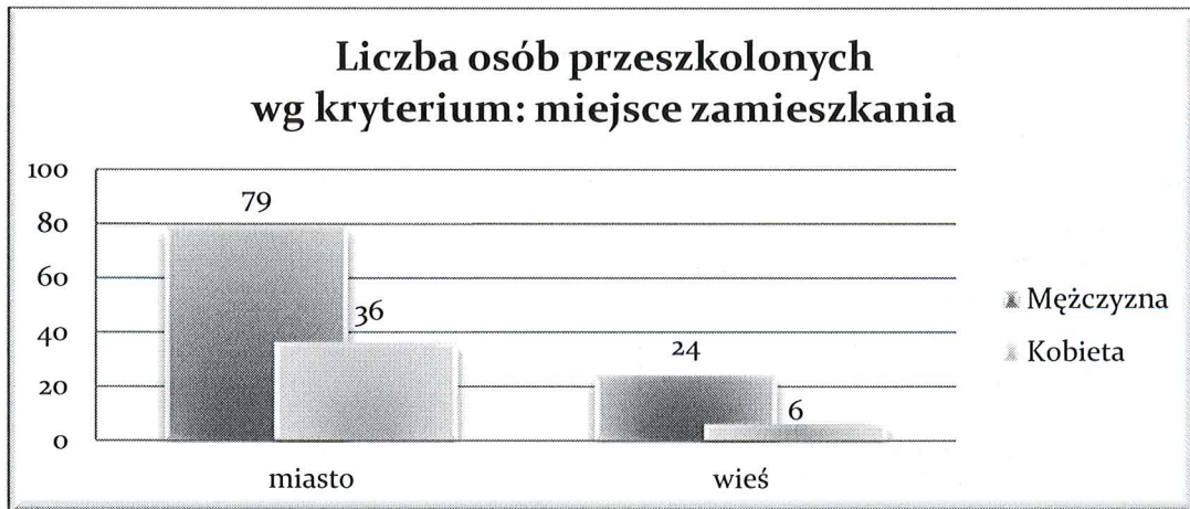
Wyk. 7 – Liczba osób przeszkolonych wg kryterium: miejsce zamieszkania