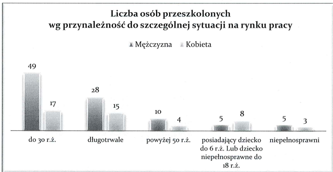
Wyk. 8 – Liczba osób przeszkolonych wg przynależności do szczególnej sytuacji na rynku pracy