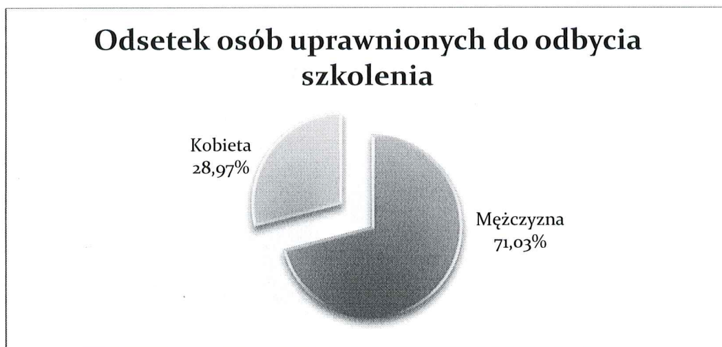
Wyk. 1 - Liczba osób uprawnionych do odbycia szkolenia