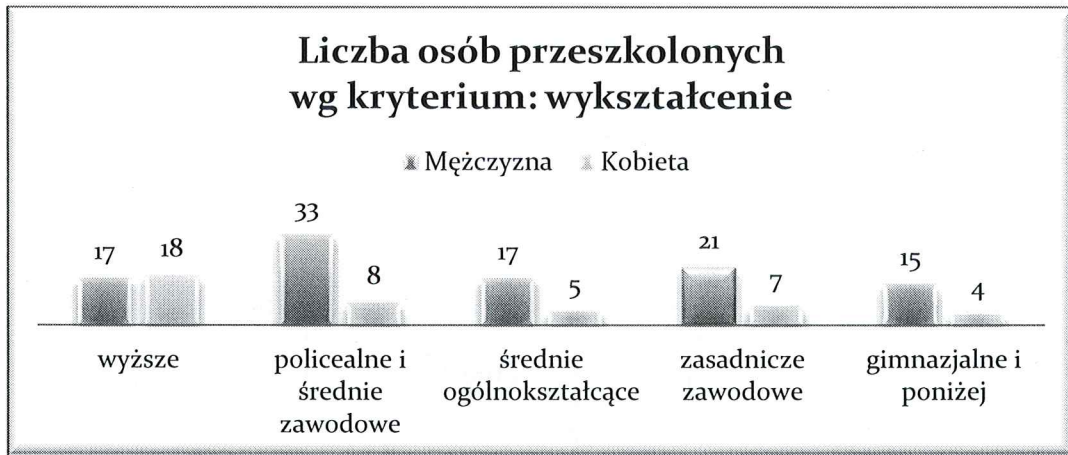
Wyk. 6 - Liczba osób przeszkolonych wg kryterium: wykształcenie